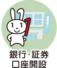
銀行・証券 口座開設