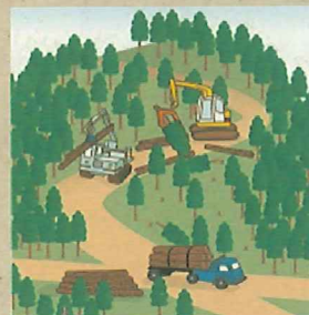
適切に森林整備を推進！

ことから、森林の土地の所有者の把握を進めるため、平成24年4月から森林法に基づく森林の土地の所有者となった旨の届出制度が創設されました。なお、この届出により、森林の土地の所有権の帰属が確定されるものではありません。