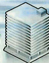
経済産業省 産業保安監督部長

http://www.meti.go.jp/policy/safety_security/industrial_safety/links/kantokubu.html